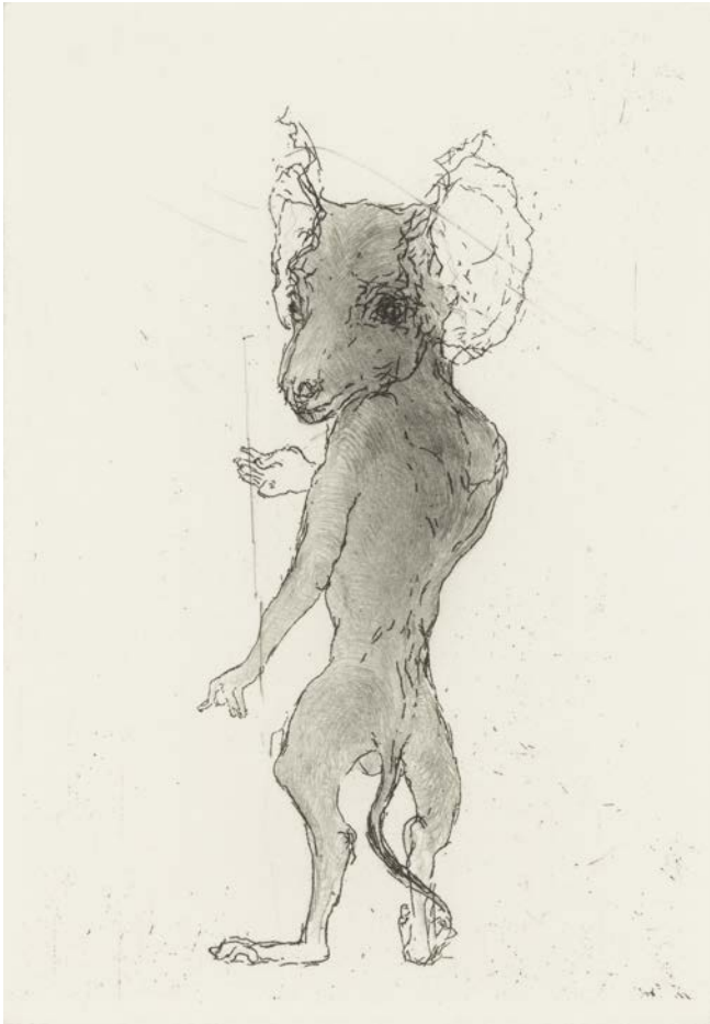
OUTI HEISKANEN: Skarp hörsel , 2001, linjeetsning och torrnl, 10 x 7 cm, HAM Helsingfors konstmuseum.

Genom hela sin produktion har Outi Heiskanen undersökt och tecknat djur, människor samt mellanting mellan djur och människa: fru bäver, åsnekvinnan, kattbaben och många fler. Hon har ända sedan barndomen haft ett nära och naturligt förhållande till djur, vilket har bevarats och funnit nya former.