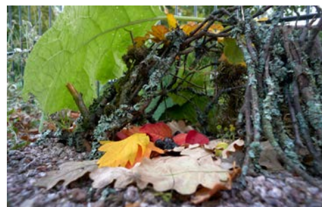
Exempel på en minikoja byggd i en lekpark.

Tilläggsuppgift att göra i skolan eller hemma: Ta en bild av din minikoja med din mobil. Studera bilden senare. Hur böjer sig kvistarna, hur ser riset och de torra löven ut? Hur ser detaljerna ut när man tittar noggrant? Teckna eller måla din koja på papper. Rita också dit en figur som kunde bo i kojor. Avsluta med att skriva ner en berättelse om figuren med inledningen: "Det var en gång ...".