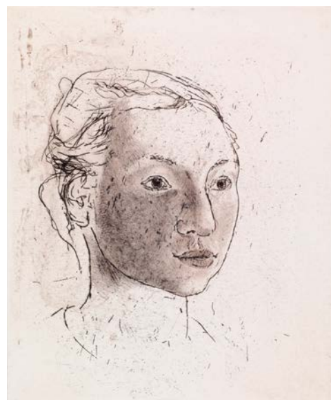
OUTI HEISKANEN: Majja , 2003, torrål och linjeetsning, 24 x 20 cm, Konstmuseet Ateneum, Tuomo Seppos samling.

Hur bilderna föds har varit en mycket personlig upplevelse för Outi Heiskanen, en mystisk process, något som hon också själv ofta har förundrat sig över. Redan när hon som ung inledde sin konstnärliga bana såg hon den levande – eller risiga – linjens skönhet. Den är föränderlig, precis som blodådror, ett vasstrå och naturligtvis ett ris.