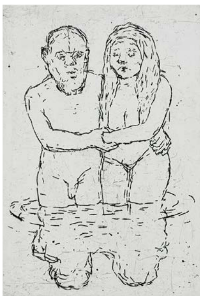
OUTI HEISKANEN: Stamföräldrar , 1979, linjeetsning, 10,5 x 7,5 cm, Sara Hildéns konstmuseum Bild: Janne Laine.