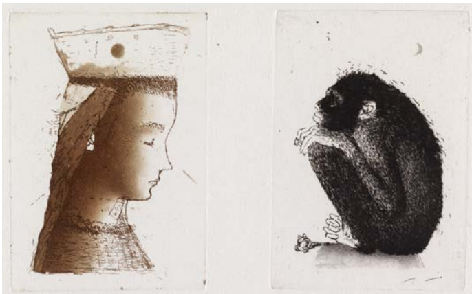
OUTI HEISKANEN: Ihailtu kaunotar , 1979, viivasyövytys ja akvatinta, 10,5 x 17 cm, Ateneumin taidemuseo.