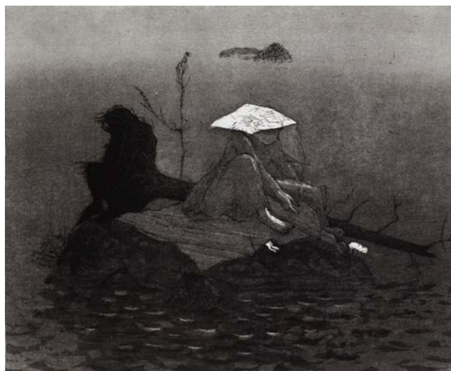
OUTI HEISKANEN: Leski (Murhe ja eukko), 1981, akvatinta ja viivasyövytys, 24,5 x 30, Ateneumin taidemuseo.