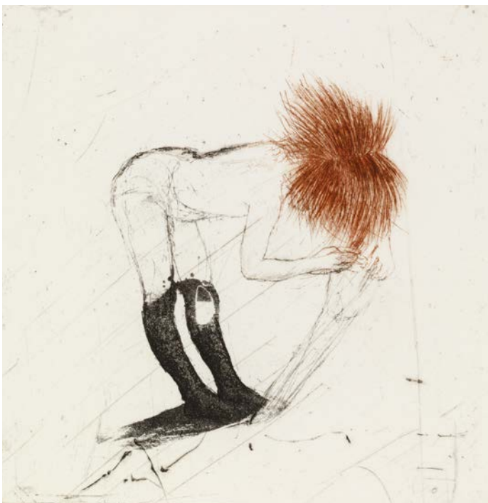
OUTI HEISKANEN: Punatukkainen tyttö , 1974, viivasyövytys, akvatinta ja kuivaneula, 14 x 14 cm, Ateneumin taidemuseo.

Outi Heiskasen teoksissa kohtaamme hänen perheensä ja laajan ystäväpiirinsä. Hän on löytänyt aiheensa mielensä kerrostumista ja arkipäivästä, kaikesta näkemästään.