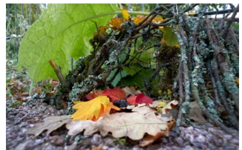
Esimerkki minimajasta.

Lisätehtävä koulussa tai kotona: Ota kännykällä kuva minimajastasi. Tutki kuvaa myöhemmin. Kuinka oksat taipuvat, miltä risu tai kuivat lehdet näyttävät? Millaisia yksityiskohdat ovat tarkasti katsottuna? Piirrä tai maalaa majasi paperille. Lisää kuvaan myös keksimäsi majan asukas. Lopuksi kirjoita hänelle oma tarina aloittaen ”Olipa kerran...”.