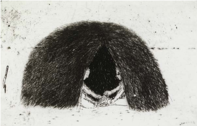
OUTI HEISKANEN: Pikkujurttia , 1977, kuivaneula ja viivasyövytys, 6 x 9 cm, Ateneumin taidemuseo.