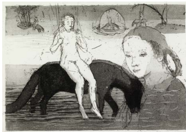
OUTI HEISKANEN: Keinu , 1980, viivasyövytys ja akvatinta, 16,5 x 23,5 cm, Ateneumin taidemuseo.