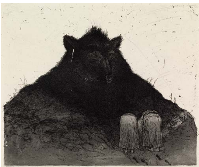
OUTI HEISKANEN: Kumarrus I , 1984, viivasyövytys ja akvatinta, 20 x 23,5, Ateneumin taidemuseo.

Läpi tuotantonsa Outi Heiskanen on tutkinut ja piirtänyt eläimiä, ihmisiä sekä eläinten ja ihmisten sekamuotoja: rouva majavaa, aasi-naista, kissavauvaa ja monia muita. Hänellä on ollut lapsuudesta lähtien läheinen ja luonnollinen suhde eläimiin, joka on säilynyt ja saanut uusia muotoja.