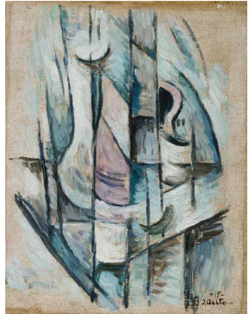
Ilmari Aalto: Kubistinen sommitelma, 1915. Kansalliskallio / Ateneumin taidemuseo.

Kubisttalaš stelledapmi (1915) lea hárvenaš ovdamearka Suoma árraáiggi kubismmas. Ilmari Aalto (1891–1934) kubisttalaš áigodat bisttii dušše 1914–1916, ja dan maŋŋá su dáidda rievvdai eanet ekspressiiva guovlluid. Kubisttalaš váikkuhusaid son oaččui duiskalaš Der Blaue Reiter -joavkku ekspressionisttalaš ja kubisttalaš čájáhusas, mii lei Helssegis 1914. Maiddái kubofutuvrralaš dáidda, man son oinnii St. Petersburgas, váikkuhii sutnje.