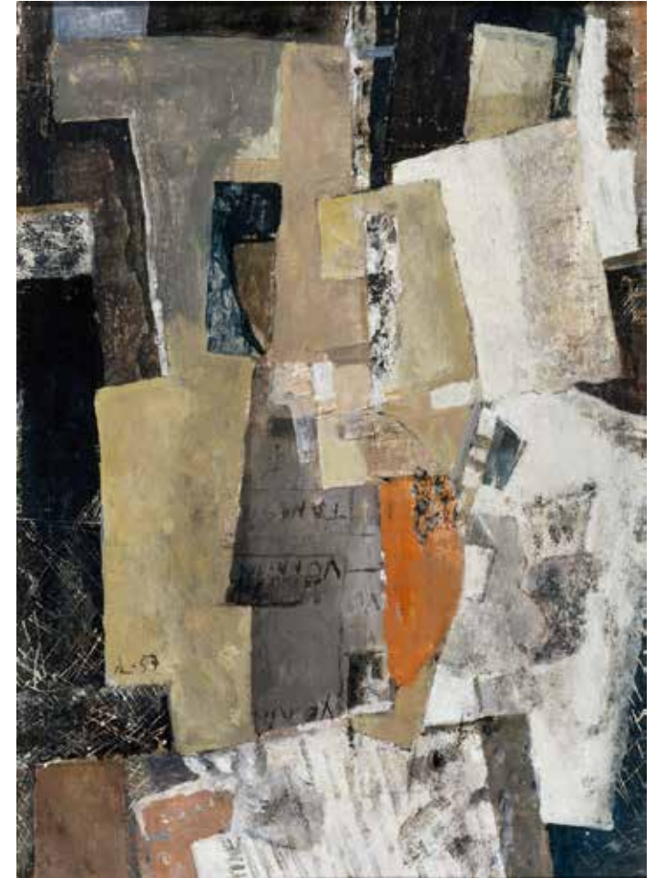
Anitra Lucander: Sommitelma, 1957. Kansallisgalleria / Ateneumin taidemuseo.