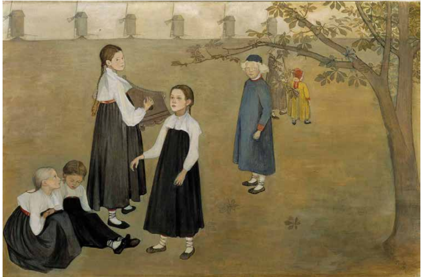
Beda Stjernschantz: Kaikkialla ääni kaikuu..., 1895. Kansallislageria / Ateneumin taidemuseo, kok. Antell.

Mánnga symbolistta mielas musihkka lei dáiddasurggiin dat buot alimus. Govas sáhtta masá gullat mo okta nieiddaš lávlu ja nubbi čuojaha. Helssegis ja Pariissas oahpu gazzan Beda Stjernschantz (1867–1910) lei 1890-logu mearkkašahti symbolista. Dát njuhtan lea su váldobargu ja dat lea ožžon namas patriohtalaš Suoma lávlla lávlaga sániin. Dat lea njuhttojuvvon Estteeatnamis Vorm sullos ja das lea niegu lágan dovdu. Govva lea seammás hervejuvvon muhto maiddái dego guorus, das leat unnán elemeanttat. Mánát ovddastit áiggehis vigihisvuodá ja rašes čábbodaga ja sii leat govvejuvvon masá ávdin birrasii, eai suoivanat, unnán ivnnit. Symbolisttaid ulbmilin ii lean áddestallat luonddu; olgguldas fáttá bargun lei álo bálvalit vuoiŋjalaš duohtavuodá ja dovdduid ovdanbuktima.