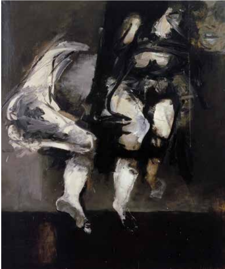
Jaakko Sievänen: Muuan yösnousemus, 1965. Kansallisgalleria / Ateneumin taidemuseo.

Lucandera Stelledeapmi -njuohtamat ovddastit friddja lyralaš abstraktismma, mii vuodđuduvvá ja gárggiida kubismmas. Vaikko visuála vuolggasadjin dáiddadujiide lea sáhttán leat ovdamearkka dihte gávpotoainnus, leat dat goittotge ovdasajis ivdne- ja hápmestelleteamit.