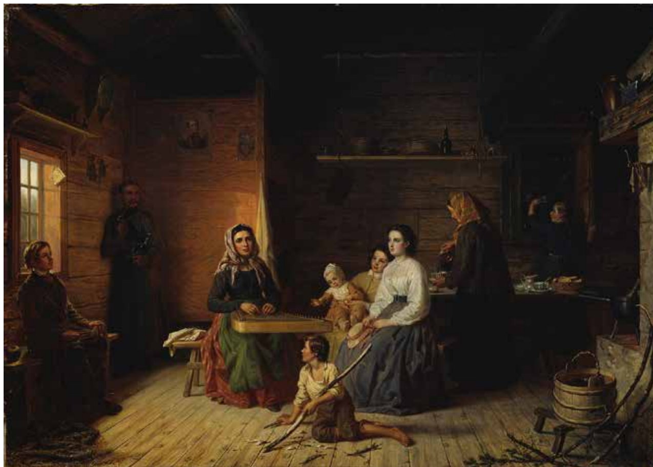
Robert Wilhelm Ekman: Kreeta Haapasalo soittaa kannelta talonpoikaistuvassa, 1868. Kansallisgalleria / Ateneumin taidemuseo.

Suomelaš eallima govvádusat váldojuvvojedje vuostá buorebut. Govva gándila čuojaheaddji nissonolbmos speadjalastá Ekman ideála oainnu suomelaš álbmogis ja dain čuvgehuslaš árvvuin, mat ovttastahttet Suoma álbmoga ja mat rasttildit servvodatluohkáid. Njuohtamis oktilašvuotta ja soabalašvuotta ožžot vel eanet deattu ovttadaddiluvvon govva bokte, mii heangá seainnis. Das ráhkistuvvon keaisár, Aleksander I, geahčada ja suodjala govvii lámhčuojuvvon dilálašvuoda.