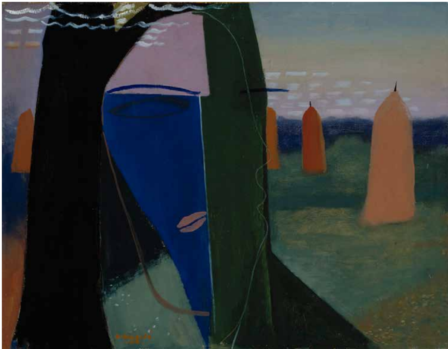
Otto Mäkilä: Kesäyö, 1938. Kansallisgalleria / Ateneumin taidemuseo, kok. Hallonblad.

Otto Mäkilä (1904–1955) lei turkulaš modernismma, nu gohčoduvvon Turku skuvlla, guovddáš dáiddár. Son studerii Turku sárgunskuvllas ja maŋgelis Pariissas, gos son oahpásmuvai ee. Pablo Picasso, Henri Matisse ja Marc Chagall dáidagii. Eandaliige Chagall duojit dolvo Mäkilä surrealismma guovlluid. Mäkilä lei suomelaš surrealismma ovdavázzi, gii juo árrat heittii govvemis olgguldas duohtavuoda. Su dáidaga váibmosis ledje su iežas siskkáldas oainnáhusaid dulkon ja olmmošvuoda suokkardallan. Mäkilä lei hui hearke daidda dovdduide ja áššiide, mat ledje jođus birastahti máilmmis. Soađi mielde Mäkilä luonddulagaš surrealisma ja siskkáldas oainnáhusat rivde eanet ah eanet dakkárin, ahte dain eai lean illušuvnnat, muhto govvidedje baicce sierranasvuoda.