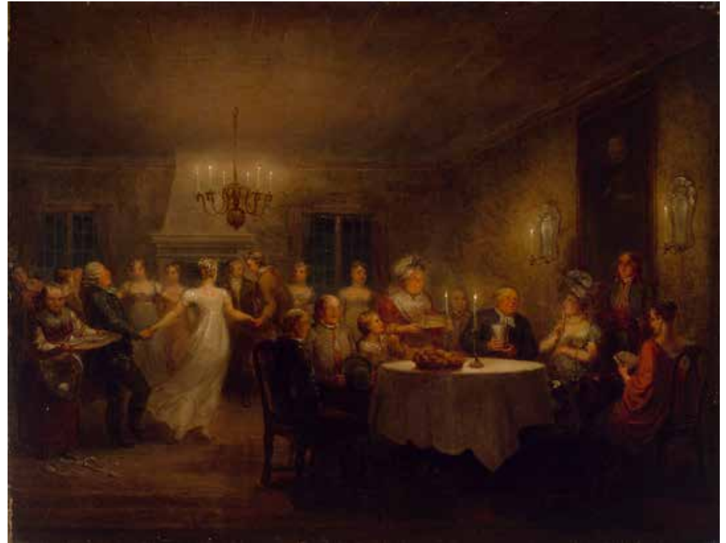
Alexander Lauréus: Pastorin kesitt, 1815. Kansallislageria / Ateneumin taidemuseo, Ateneumin ystävien kokoukma.

Lauréus ii sáhttán gazzat ámmátlaš dáiddaoahpu Suomas go dakkár ii lean. Ruhtačoaggin attii vejolašvuoda álggahit oahpuid Stockholmma gonagaslaš dáiddaakademiijas 1802. Lauréus oaččui Stockholmmas dáiddaakademiija miellahttuvuoda ja hoavvanjuohtti árvonama. Guđa jagi mátkestipeandda vehkiin son dagai oahppomátkki vuos Pariisii, maŋnelabbos Romai, ja vuojui mátkkiidis alde govvidit eanaš dábálaš olbmuid eallima. Roma áigodagas Lauréus lei hutkái ja kreatiiva. Son lei maid doalvumin dáidágis eanet ja eanet realismma guovlluid, muhto de son buohccái báifáhka feberdávdi ja ná su bálggis dáiddárin nogai dasa. Jápmima maŋná Suoma Dáiddasearvi loktii Lauréusa suomelaš njuohtandáidaga ovdagovvan.