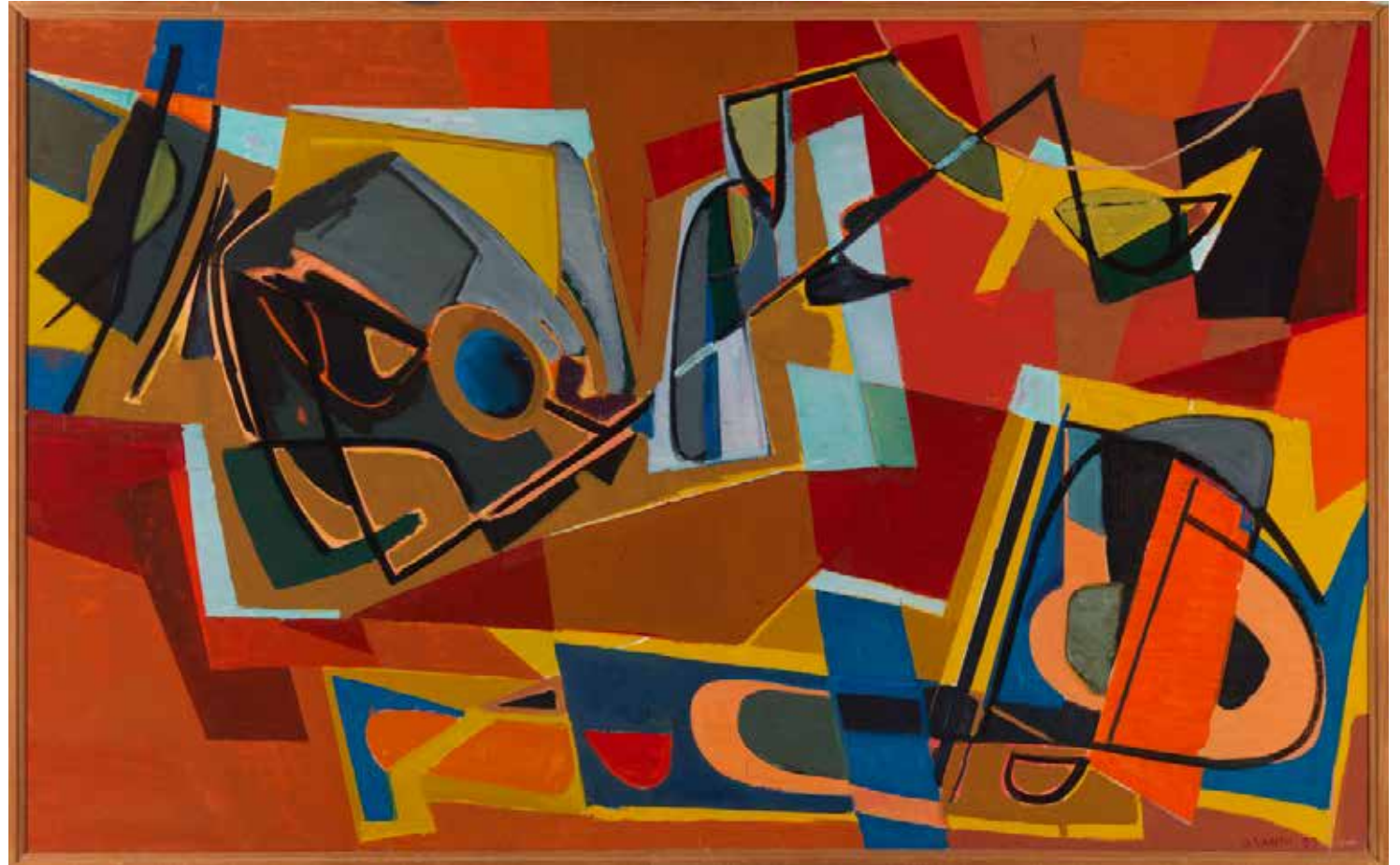
Sam Vanni: Sommitelma, 1957. Kansallisgalleria / Ateneumin taidemuseo.

1950–70-loguid Suomas olbmot fárrejedje boaittoabeale guovlluin gávpogiidda, main industriija lei lassánišgoahtán. Fárren bohciidahtii olbmuid maid jurddašit. Studeanttat geavahišgohte jienaset servodaga boasttuvuođaid divvumii. Moriheapmi oidnogođii musihkas, teáhteris, girjjálašvuodas, ealligovain ja govvadáidagis. Riikkaidgaskasaš dáidaga mearkkašupmi lassánii. Ateneum dáiddamusea ordnii 1961 vuosttas ARS-čájáhusa, mii buvttii Supmii earenoamážit italialaš, fránskalaš ja spánskalaš informalismma. Dan váikkuhus dihttui maid mángga suopmelaš dáiddára buvttadeamis.