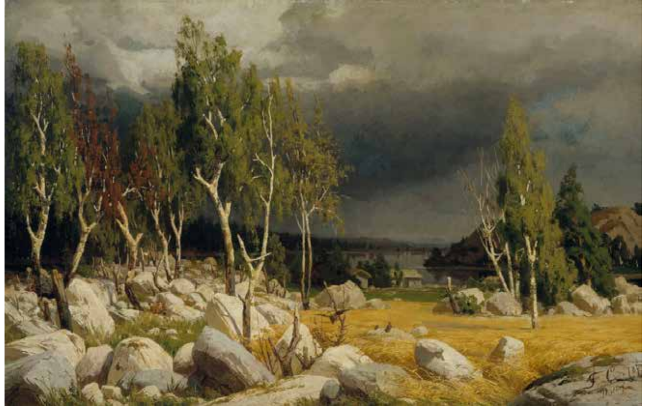
Fanny Churberg: Kaski, maisema Uudeltamaalta, 1872. Kansallisgalleria / Ateneumin taidemuseo, kok. Ahlström.

Čájáhusa lea buvttadan Álbmotgalleriija / Ateneum dáiddamusea ja dan kuráhtor lea amanueansa Anu Utriainen.