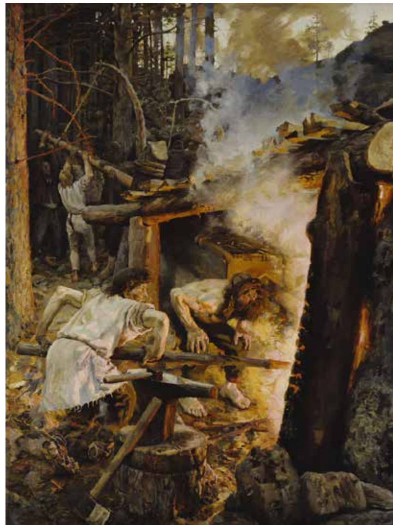
Akseli Gallen-Kallela: Sammon taonta, 1893. Kansallisgalleria / Ateneumin taidemuseo.

Kalevala myhtalaš olbmot ja muitalusat movttiidahte dáiddáriid gitta álggu rájes. Govvadáidaga bealde gievrramus dulkojumiid Kalevala oaččui 1800- ja 1900-loguid molsašumis. Dalle álbmotromantihkalaš Gárjila ovddošepmi nappo karelianisma doalvvui dáiddáriid ohcat govalaš ja visuála váikkuhusaid Gárjilis, gos stuorámus oassi Kalevalai heivehuvvon divttain leat čoggon. Okta dain dáiddáriin lei Akseli Gallen-Kallela.