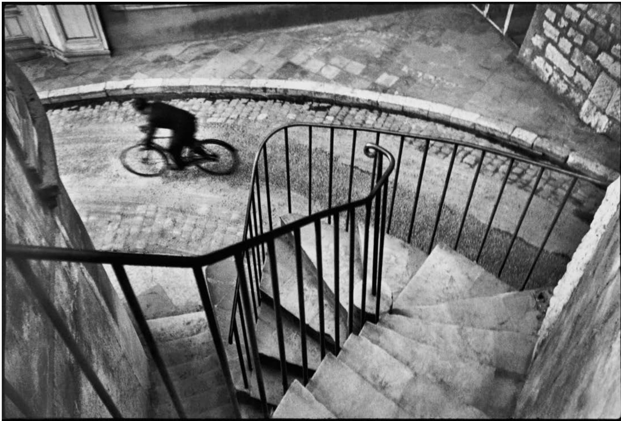
HYÈRES, RANSKA, 1932.